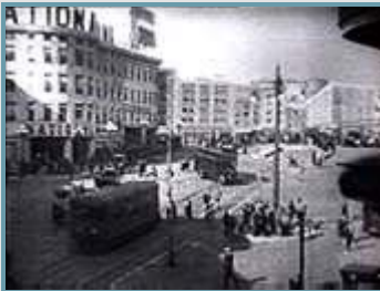
Gran plano general

La clasificación de planos está referenciada a la figura humana.