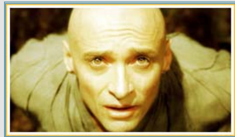
Plano picado puro